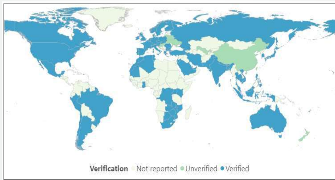
شکل ۲. توزیع واریانت دلتای کووید-۱۹ در مناطق مختلف دنیا تا تاریخ ۲۹ ژوئن ۲۰۲۱

به نظر می‌رسد در حال حاضر در کشور ما هم افزایش ویروس دلتا نگرانی‌هایی را برای مدیریت اپیدمی و سیاست‌گذاران ایجاد نموده است. لذا در ادامه سعی شده است به‌صورت ویژه در خصوص ویژگی‌های این واریانت توضیحاتی ارائه گردد.